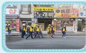
자율방범대 '호성 방디블'