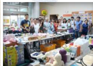
바자회 판매 전 물품준비! 판매대박을 기원하며 파이팅!!

무더웠던 어느 여름 날, 무더위를 날려줄 시원~한 행사가 우리 센터에서 펼쳐졌는데요, 바로 “이주민을 위한 사랑의 바자회”입니다. 특별히 삼성전자 메모리제조센터 E/F팀 임직원 분들이 직접 준비해오신 다양한 물품들 (생필품, 가전제품, 도서, 의류 등)이 정말 저렴한 가격에 판매되어 시원하게 쏘는! 의미를 더했습니다.^^ 물품준비 뿐 아니라 진열, 판매까지 도맡아 진행하시며 센터를 찾은 이주민과 소통하는 뜻 깊은 시간도 되었답니다.