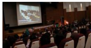
2014년도 사업보고 영상! 모두모두 수고 많았습니다♡