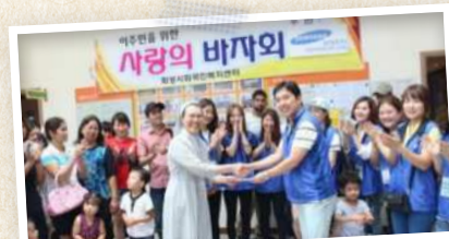
사랑의 바자회 판매 수익금은 이주민 편의활동과 긴급지원 등에 사용되었습니다.

이날 삼성전자 봉사팀에서 준비한 물품에 대한 판매 수익금은 이주민의 복지를 위해 전액 후원해 주셨습니다. 생각보다 많은 판매금액이 모여 따뜻한 사랑을 전할 수 있었습니다.