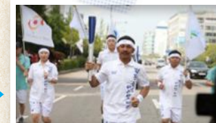
성화를 들고 힘차게 달려가 봅시다~!!