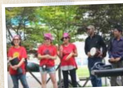
막간 댄스타임으로 바자회 분위기 UP!

사랑의 바자회가 무르익는 동안, 많은 이주민들이 다양한 물품을 저렴한 가격으로 구입하였습니다. 값이 싸다고 품질이 떨어질 것이라는 생각은 금물! 이주민들의 만족도는 높았습니다^^ 바자회의 포인트는 종료 직전, ‘대박세일 타임’인데요, 흥겨운 댄스타임으로 분위기를 돋우고 남은 품목 할인판매가 이어졌습니다.