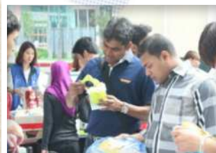
물건구입의 기분은 꼼꼼히 살펴보는 것!