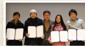
한국어교실 대표 수료자 여러분, 모두 내년에도 파이팅!