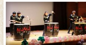
우리 센터에서 외국인주민을 위해 열심히 봉사하시며 공연도 준비해주신 한울나타팀의 신나는 난타 공연

1부 사업보고회에 이어 2부 “행복 나눔 공연”이 진행되었습니다. 올 한해 열심히 갈고 닦은 외국인주민 여러분들이 직접 준비한 공연이 펼쳐졌는데요, 작은 공연이었지만 모두 함께 즐기기에 더할 나위 없는 행복한 시간이었습니다.