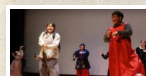
끝으로 펼쳐진 무대는 화성시외국인복지센터 선생님들의 무대! 다함께 망가졌습니다. π_π 2015년에는 더 재미난 무대로 돌아올게요~^^

2014년 한 해, 화성시외국인복지센터와 함께 해 주신 모든 분들께 마음속 깊이 감사 드립니다.