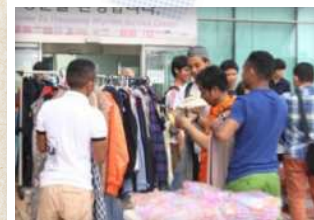
옷은 꼭 입어보고 사세요^^

사랑의 바자회가 무르익는 동안, 많은 이주민들이 다양한 물품을 저렴한 가격으로 구입하였습니다. 값이 싸다고 품질이 떨어질 것이라는 생각은 금물! 이주민들의 만족도는 높았습니다^^ 바자회의 포인트는 종료 직전, ‘대박세일 타임’인데요, 흥겨운 댄스타임으로 분위기를 돋우고 남은 품목 할인판매가 이어졌습니다.