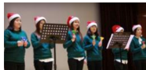
결혼이주여성과 중도입국자녀의 신나는 핸드벨 캐롤 연주로 행사의 시작을 알렸습니다.