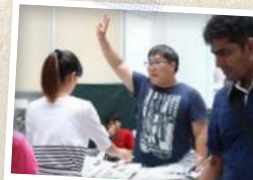
흥겨운 댄스타임도 이어졌 습니다^^ “27H에 3천원!”