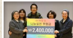
외국인 공동체를 통한 후원금 전달식~ 소중한 곳에 사용되길 기도합니다.

지난 9월, 화성시 세계문화축제 “세계의 소리, 하나의 소리”에서 외국인주민들이 직접 ‘세계음식문화 체험’ 부스를 운영하여 모은 소중한 수익금 전달식이 진행되었는데요, 이는 외국인 공동체의 노력과 헌신으로 만들어진 금액으로 외국인 주민을 후원하는 각 단체에서 어려운 외국인들을 추천받아 연말 따뜻한 마음을 전했습니다.