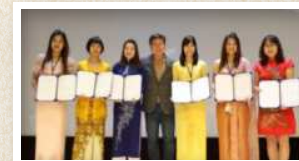
예쁜 전통의상을 입은다문화강사 여러분 수고했습니다~