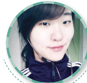
수원대학교 World COOP 봉사동아리