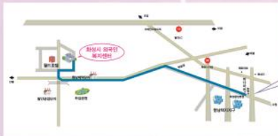
화성시외국인복지센터 홍보게시판은 바다마트 옆 농협 앞에 위치해 있습니다.