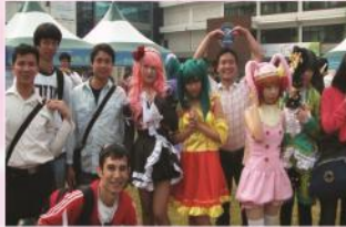
지역 내 다문화 행사 홍보부스 운영