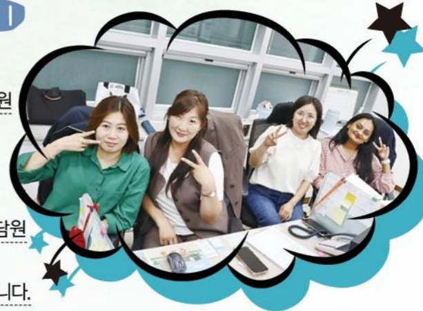
왼쪽 부터 베트남, 러시아, 몽골, 스리랑카 선생님